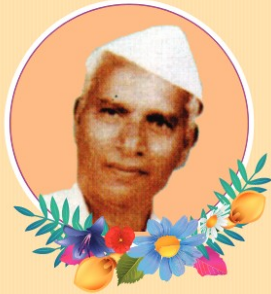
स्व. चं. भि. धनवटे संस्थापक, अध्यक्ष, अ. जि. प्राथ. शिक्षक विकास मंडळ, अ.नगर